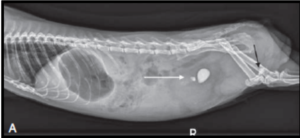
Legenda: (A) Presença de cálculo em bexiga.

Um problema bastante comum em porquinhos-da-índia é o desenvolvimento de cálculos urinários, principalmente vesicais (bexiga).